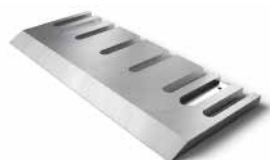
Knives and parts for production of particle boards, MDF and OSB boards Nože a díly pro výrobu dřevotřískových desek, MDF desek a OSB panelů