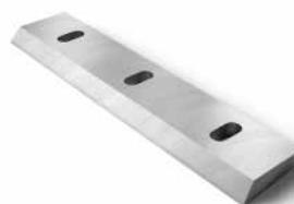
Recycling knives Recyklační nože