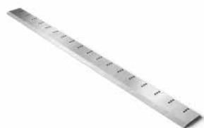
Peeling and slicing knives Loupací a krájecí nože