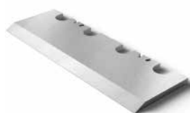
Chipper knives and accessories Sekací nože a příslušenství