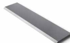
Knives for secondary processing of wood Nože pro sekundární zpracování dřeva