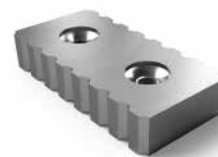
Knives for scrap metal recycling Nože pro stříhání železného šrotu