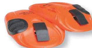
vyměnitelné kryty mušlí replaceable earmuff cover